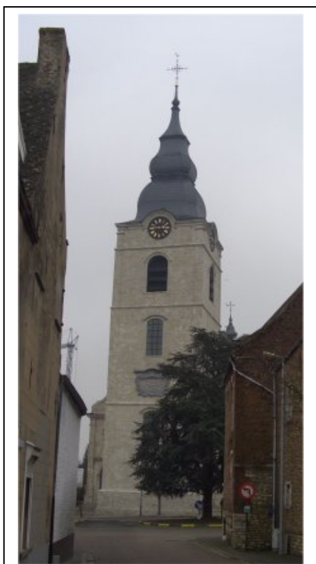
Hoegaarden : Eglise Saint-Gorgon

Un document historique fait déjà mention de l'existence d'une brasserie, à Hoegaarden, en 1318. La tradition d'une bière blanche trouble naît de l'omniprésence du froment, la principale céréale cultivée dans la région. (...)